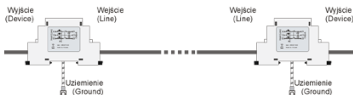
Schemat prawidłowego zabezpieczenia M-BUS