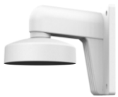
DS-1272ZJ-110-TRS Uchwyt ścienny