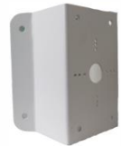
DS-1276ZJ Uchwyt narożny